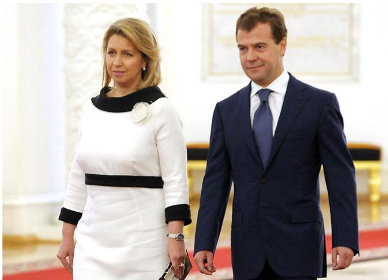
Fotografia 7. Swietłana i Dmitrij Miedwediewowie.

Za Dmitrija Miedwediewa wyszła w 1993 roku.