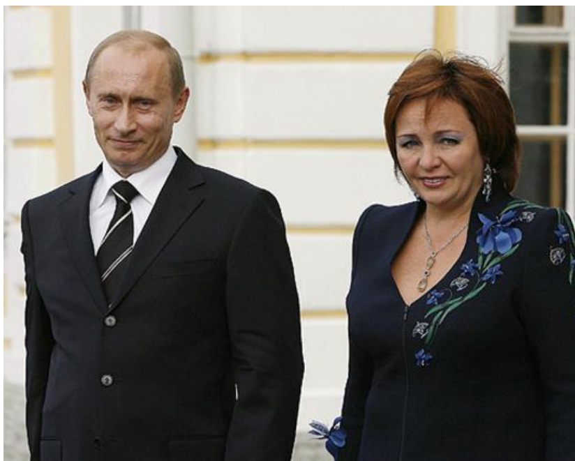
Fotografia 4. Ludmiła i Władimir Putinowie.

Władimir Putin i Ludmiła Szkrebniewa poznali się w 1980 roku w Leningradzie przy kasie biletowej Teatru Lensowietu. Spotkanie zorganizował ich wspólny znajomy, który postanowił poznać 22-letnią stewardesę ze starszym o 5 lat oficerem służb specjalnych. Jak przyznawała się później Ludmiła, na początku nie miała pojęcia, czym zajmuje się mężczyzna, z którym się spotyka. Dopiero po 1,5 roku znajomości dowiedziała się, dlaczego Władimir czasem znika i nie chce mówić, czym się przez ten czas zajmował. Ślub wzięli po 3 latach znajomości, w lipcu 1983 roku.