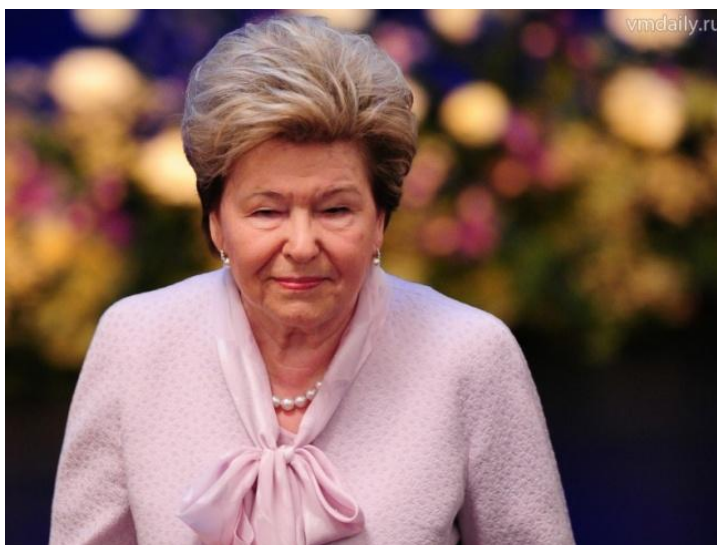
Fotografia 1. Naina Jelcyna.