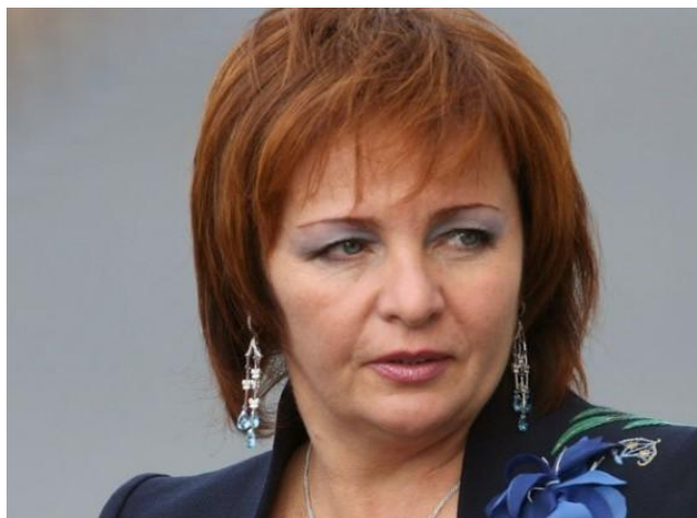
Fotografia 3. Ludmiła Putina.