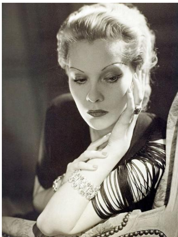
Fotografia 4. Księżna Natalia Paley.