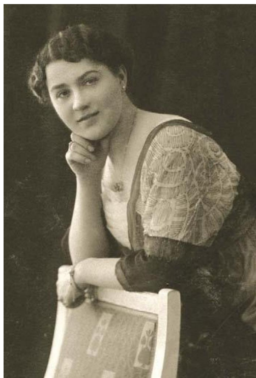
Fotografia 11. Anna, hrabina Vorontsova-Dashkova.