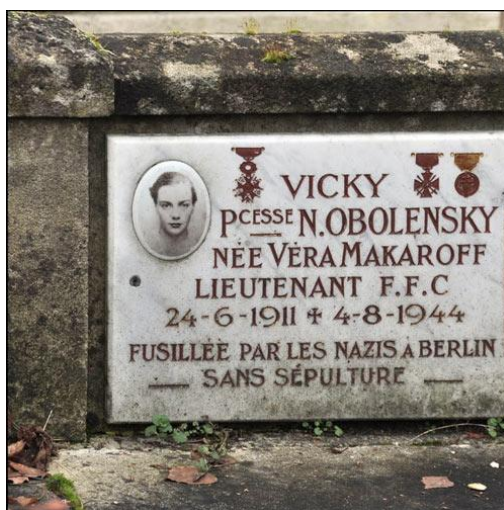
Fotografia 20. Tablica na cześć Very Obolenskiej.

W lipcu 1944 roku, po inwazji Aliantów w Normandii, księżną przewieziono do Berlina, gdzie została stracona na gilotynie. Od wyprowadzenia jej ze spacerniaka do sali śmierci do położenia na gilotynie i wykonania wyroku upłynęło zaledwie 18 sekund. Jej ciało przekazano studentom medycyny do badań i nauki. Nie ma jej grobu, ale na cmentarzu rosyjskim Sainte-Geneviève-des-Bois na jej cześć ustawiono kenotaf (pusty grobowiec). Na pomniku ofiar wojny w Normandii znajduje się pamiątkowa tablica z jej nazwiskiem.