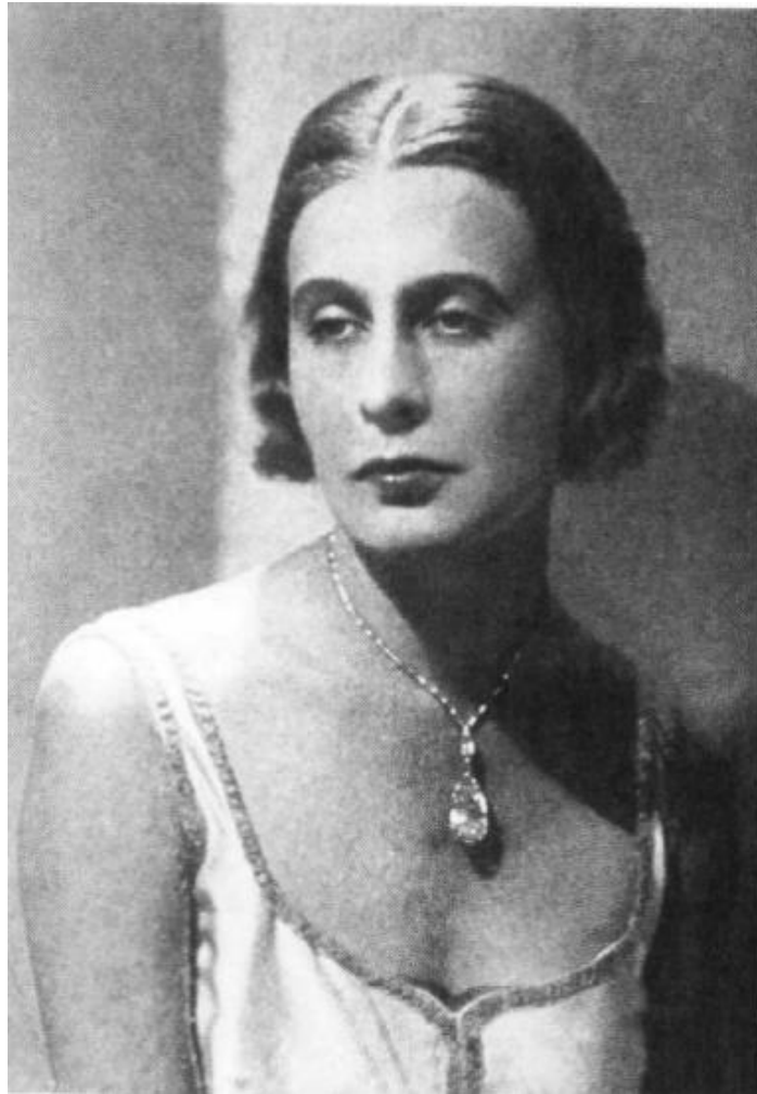
Fotografia 12. Lady Abdy.