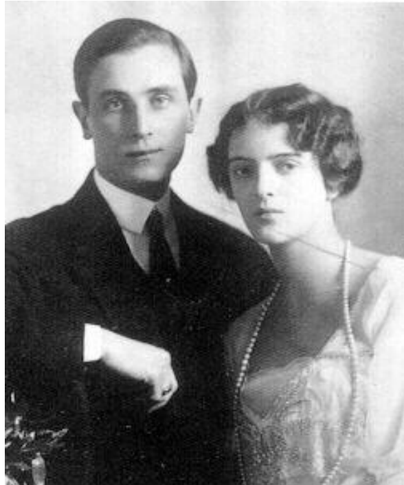
Fotografia 2. Irina i Feliks Jusupov.