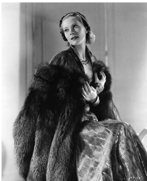
Fotografia 5. Księżna Natalia Paley.