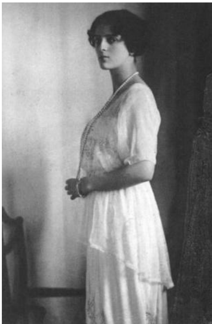
Fotografia. 1. Księżna Irina Yusupov.