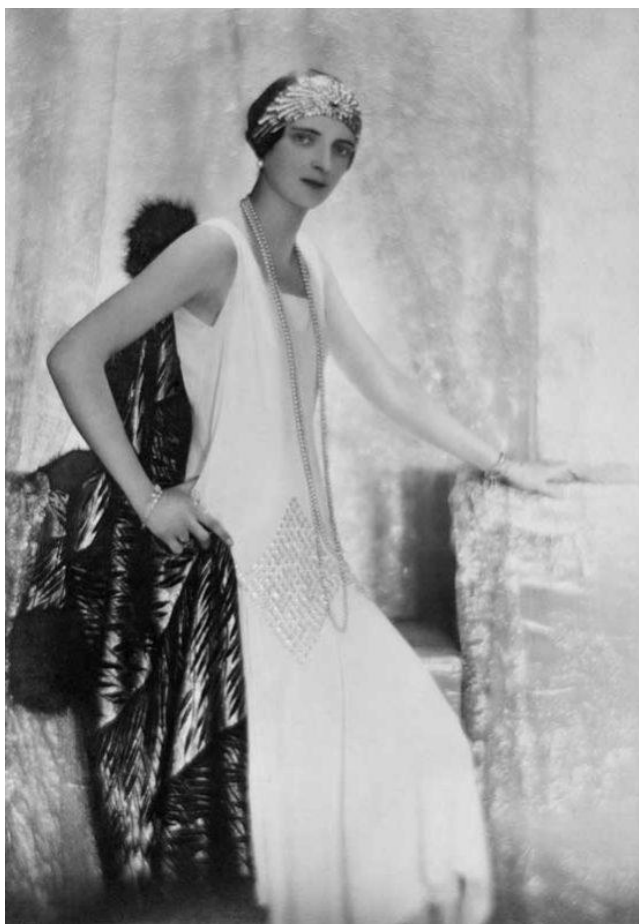
Fotografia 3. Irina Yusupov jako modelka domu mody „Irfe”.

Dom świetnie prosperował do 1931 roku 1 , kiedy to na skutek recesji w USA większość amerykańskich klientów zbankrutowała. W tym czasie w Paryżu sukcesy odnosiła Coco Chanel i Christian Dior.