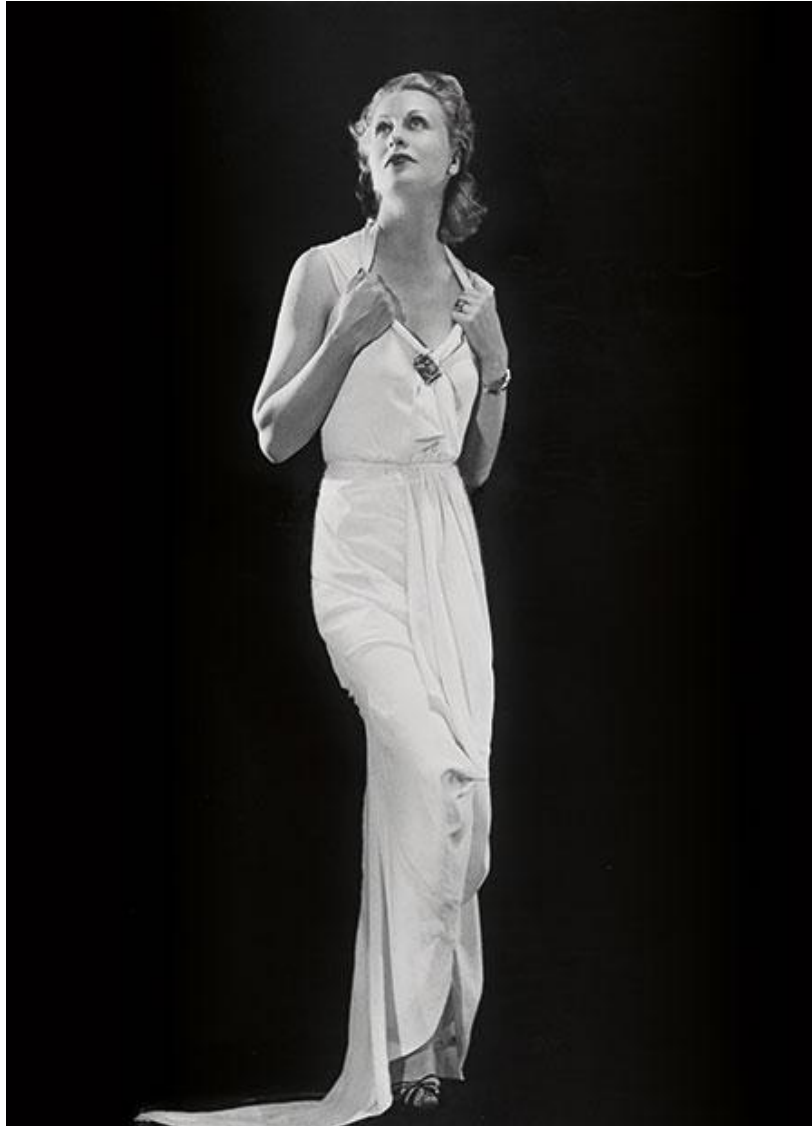
Fotografia 13. Lady Abdy.