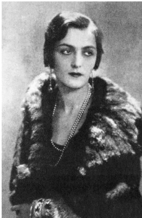
Fotografia 6. Księżna Maria Eristavi.