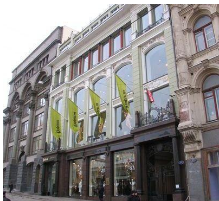
Fotografia 1. Budynek byłego Domu Mody na Moście Kuźnieckim.