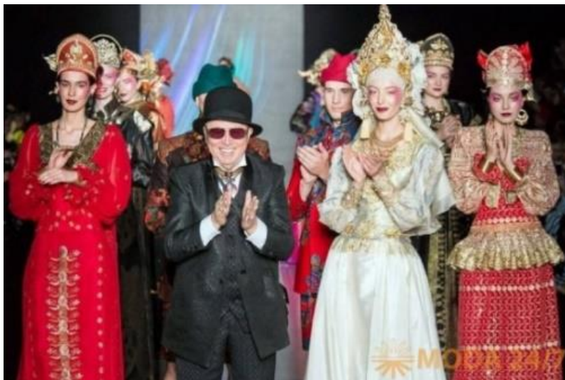
Fotografia 40. Kolekcja Zajcewa.