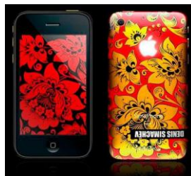
Fotografia 58. Kolekcja iPhone D. Simacheva.

Oprócz odzieży zaprojektował z malowidłami „pod chochlomę” lodówkę „Rosenlew”, meble, iPhone, samochody, aparat fotograficzny „Leica”, pościel, bieliznę.