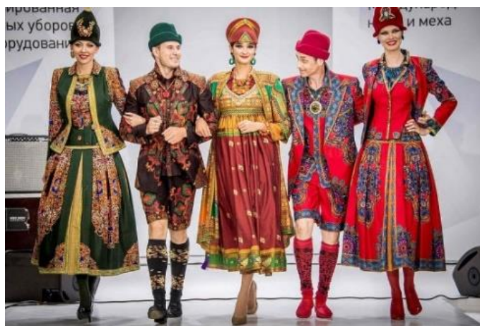
Fotografia 39. Kolekcja Zajcewa.