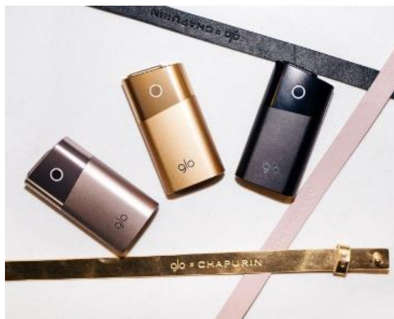
Fotografia 64. System „Glo” Czapurina.

Obecnie projektuje odzież prêt-à-porter, haute couture, pościel, wyroby jubilerskie. W 2018 roku zaprojektował odzież dla pracowników „Alfa-Banku”, a w 2019 roku akcesoria do systemu podgrzewania tytoniu „glo”.