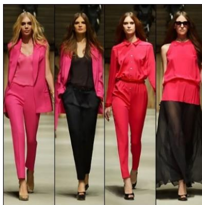
Fotografia 62. Kolekcja I. Czapurina.

Źródło: http://russia-ic.com/society_politics/fashion_design/1661#.XWUXq_ZuJuk (dostęp: 27.08.2019).