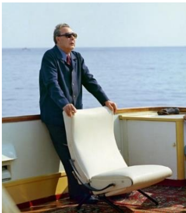
Fotografia 36. Leonid Breżniew podczas wypoczynku na jachcie.