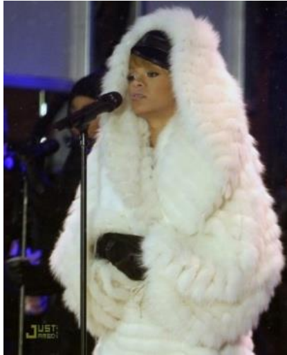
Fotografia 28. Rihanna w futrze Helen Jarmak.