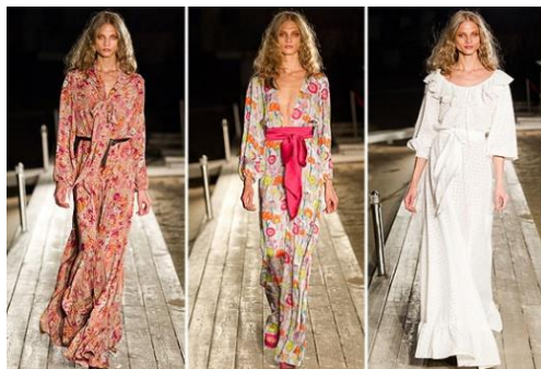
Fotografia 25. Kolekcja Maszy Cigal.