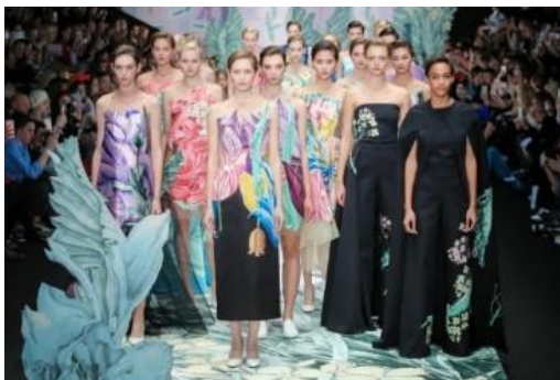
Fotografia 19. Kolekcja „Alena Akhmadullina” dla Barbie.

W 2007 roku wygrała konkurs na projekty strojów rosyjskiej reprezentacji narodowej na Olimpiadę 2010 roku w Vancouver, a oprócz tego zaprojektowała koszulki na konkurs „Eurovision” w Moskwie w 2009 roku. Zajął się również projektami ekskluzywnych torebek i obuwia, a 1% ze sprzedaży przekazała na Fundusz Ochrony Dzikiej Przyrody. W 2008 roku otworzyła butik w Moskwie, a potem w Londynie, Szanghaju, Genewie i innych miastach. W 2015 roku współpracowała z firmą kosmetyczną „Natura Siberica”, projektowała kostiumy teatralne na 80-lecie gimnastyki artystycznej w Rosji i stworzyła kolekcję dla „Barbie”.