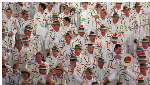
Fotografia 46. Stroje reprezentacji rosyjskiej na Olimpiadzie w 1996 roku.