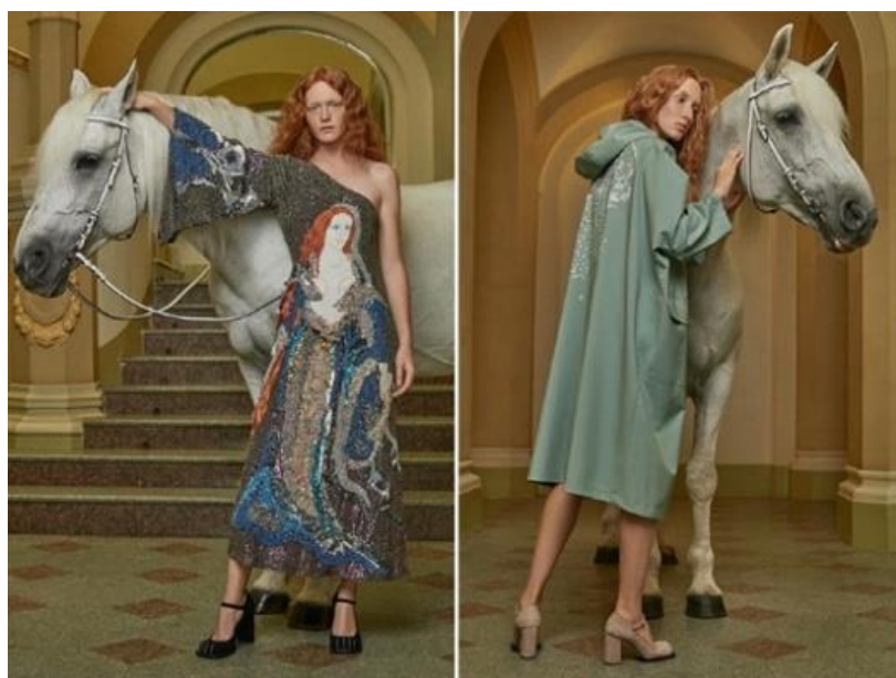
Fotografia 22. Kolekcja „Wiosna-lato 2019”.

Jej ostatnie projekty z 2019 roku zainspirowane zostały średniowieczem. Dominują motywy słońca, lwów i jednorożców ( Алена Ахмадуллина, 2010-2019 ).