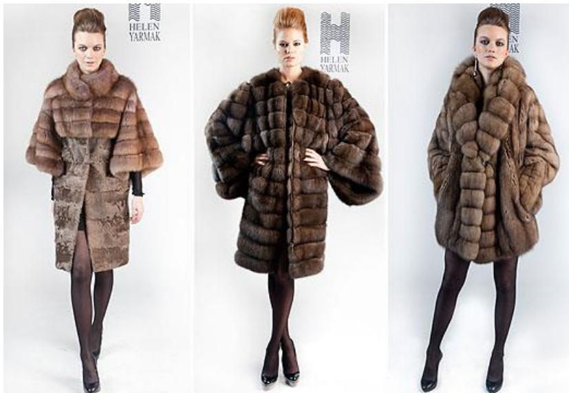
Fotografia 29. Kolekcja futer H. Yermak.

Znak rozpoznawczy Eleny to luksusowe futra z sobola, lisa, karakułów, gronostaja, torebki, akcesoria, biżuteria.