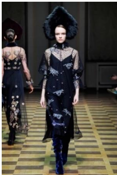
Fotografia 21. Kolekcja „Szary wilk”.