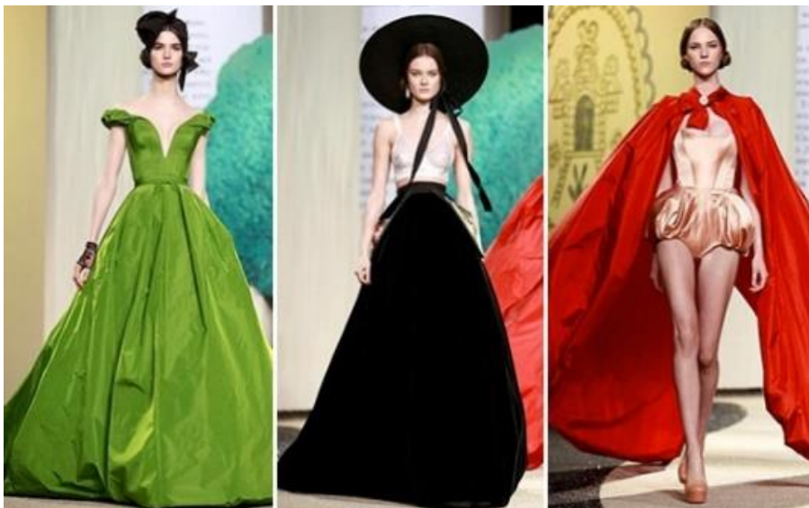
Fotografia 16. Kreacje U. Sergiejenko.