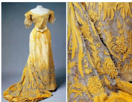
Fotografia 2. Suknia wieczorowa cesarzowej Aleksandy Fiodorowny.