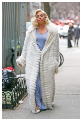
Fotografia 27. Lady Gaga w futrze Helen Jarmak.