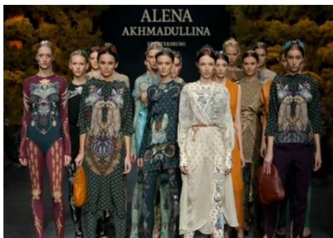
Fotografia 18. Kolekcja „Alena Akhmadullina”.