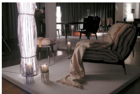
Fotografia 60. Kolekcja „Chapurincasa”.