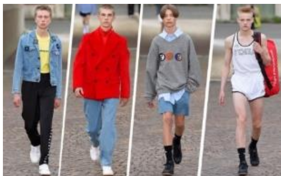
Fotografia 49. Kolekcja G. Rubczyńskiego.

Swoje życie prywatne ukrywa, jednak w 2018 roku oskarżono go o molestowanie i pedofilię. W sieci opublikowano niby jego screenshotty z bardzo prywatną korespondencją z 16-latką, w której prosił o zdjęcie chłopca z łazienki. Tłumaczył to zemstą chłopaka, który nie wygrał castingu na modela oraz tym, że tekst wyrwano z kontekstu, a chodziło o zdjęcia do castingu. Wszystkie castingi odbywają się przez sieci społecznościowe (Боброва, 2018). Modelami rzeczywiście są nastolatki.