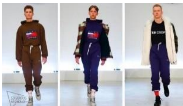
Fotografia 50. Kolekcja G. Rubczyńskiego.