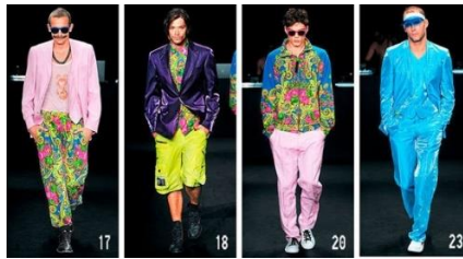
Fotografia 56. Kolekcja D. Simaczowa.

Źródło: https://www.yuga.ru/news/343830/ (dostęp: 27.08.2019).