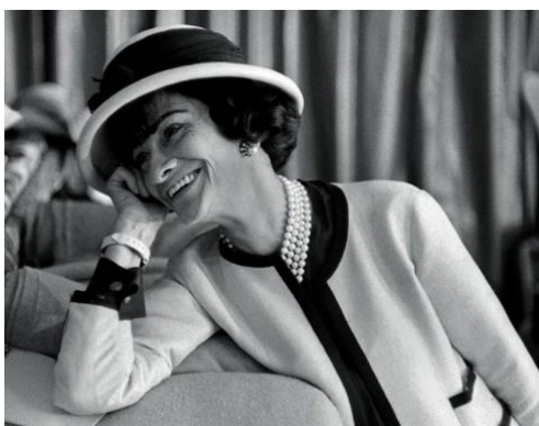
Fotografia 5. Barbara Karinska.