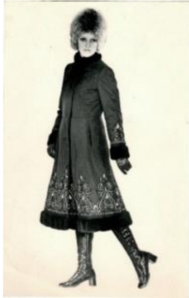
Fotografia 11. Płaszcz zaprojektowany przez Alę Lewaszową.