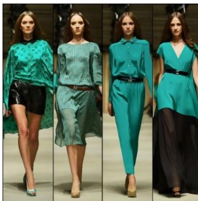
Fotografia 61. Kolekcja I. Czapurina.

W 2005 roku otrzymał nagrodę „Projektant Roku” rosyjskiego wydania czasopisma „GQ”, a w 2007 roku na ceremonii „Elle Style Awards” otrzymał nagrodę w kategorii „Wektor Mody” i od tego roku regularnie bierze udział w paryskim tygodniu mody.