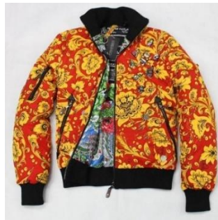
Fotografia 57. Kurtka D. Simaczowa.