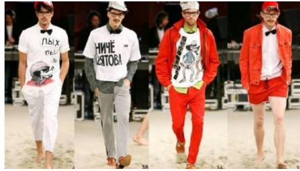
Fotografia 55.

Często ubiera modeli w kamizelki kuloodporne i kominiarki (Sijka, 2003).