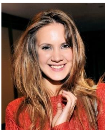
Fotografia 30. Kira Plastinina.