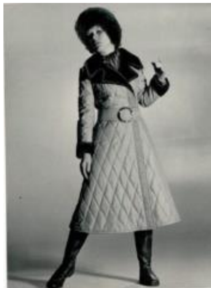
Fotografia 12. Płaszcz zaprojektowany przez Alę Lewaszową.