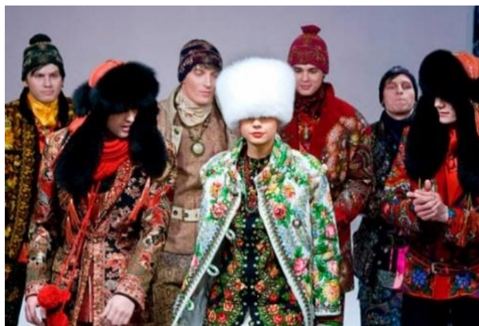
Fotografia 38. Kolekcja Zajcewa.

W 1987 roku w Nowym Jorku zaprezentował kolekcję „Tysiąclecie Chrztu Rusi”, która zapoczątkowała modę na rosyjskie motywy, tak mu bliskie do dziś. Zazwyczaj kojarzy się z elementami ludowymi, nakryciami głowy – tzw. kokosznikami 13 , chustkami z Pawłowskiego Posadu 14 .