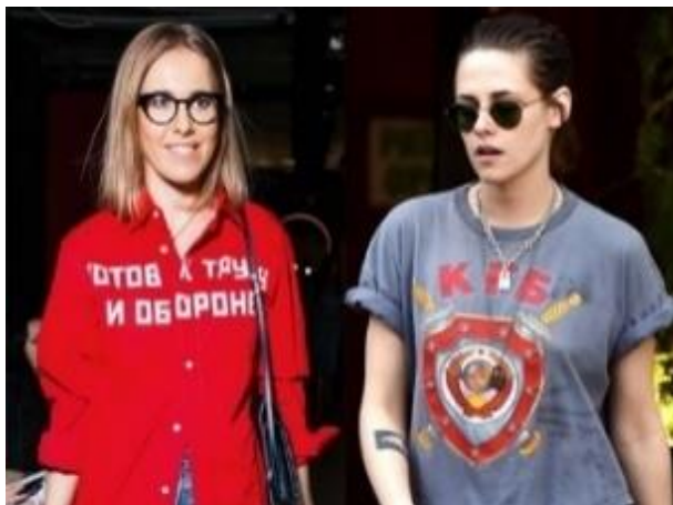
Fotografia 51. Kolekcja G. Rubczyńskiego.