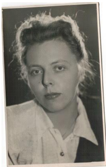
Fotografia 10. Ała Lewaszowa.