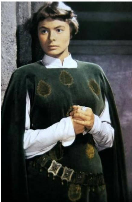
Fotografia 7. Ingrid Bergman jako Joanna d’Arc w kostiumie Barbary Karinskiej.

Pracowała również dla teatru na Broadwayu, tworzyła stroje do filmów w Hollywood, a jej kreacje nosiły Marlen Ditrich, Ingrid Bergman czy Vivien Leigh. Za kostiumy do filmu „Joanna d’Arc” po raz pierwszy w historii otrzymała Oscara.