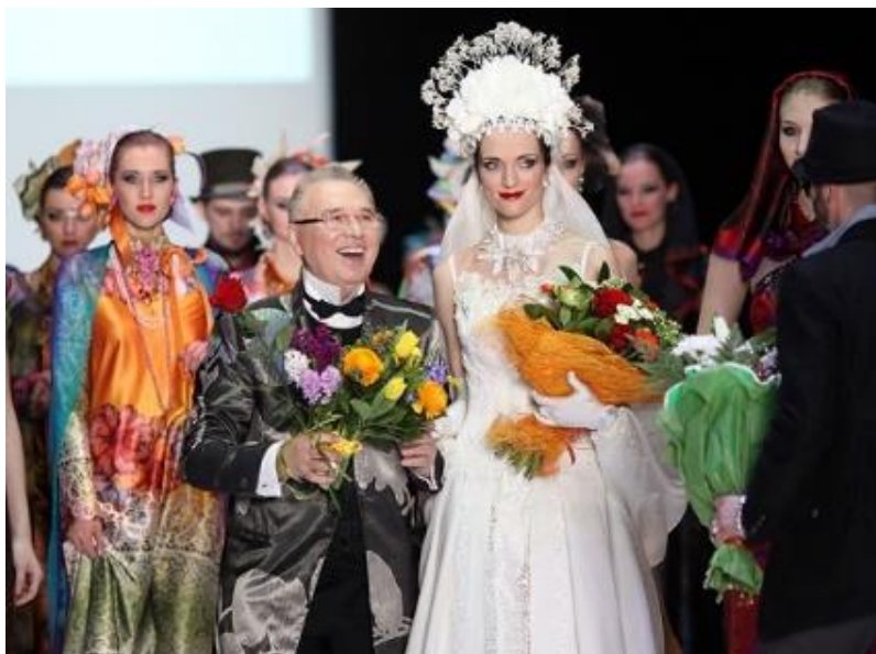
Fotografia 41. Kolekcja Zajcewa.