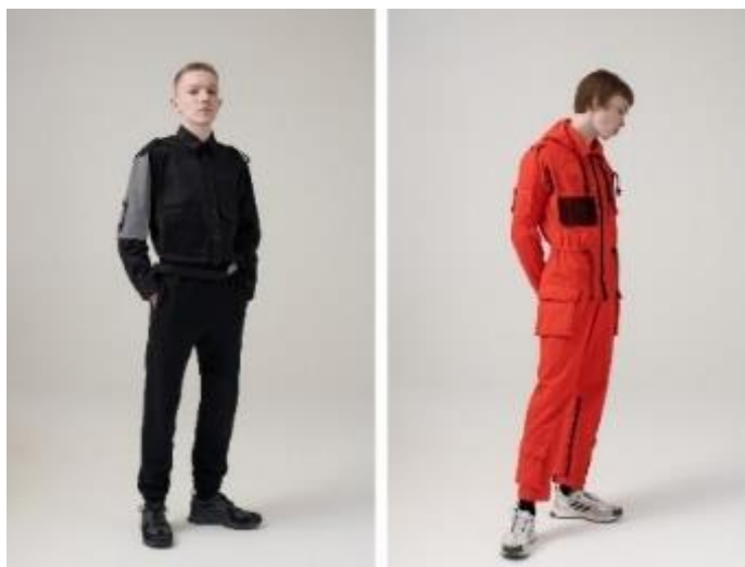
Fotografia 52. Kolekcja „GR-Uniforma”.

W 2018 roku poinformował o zamknięciu marki „Gosha Rubchinskiy”, a niedawno, że uruchomił nowy projekt, „ГР-Униформа” („GR-Uniforma”), gdzie oprócz odzieży będzie muzyka, video i video album z Gruzji ( Гоша Рубчинский запускает... , 2019). W nowej marce są kombinezony w czerwonym kolorze, z kieszeniami na śruby i śrubokręty, wypłowiałe żółte kamizelki, połatany kombinezon z jeansu dla firmy „Diesel” (Różyc, 2019).