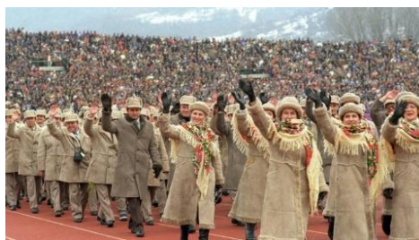
Fotografia 45. Stroje reprezentacji radzieckiej na Olimpiadzie w 1984 roku.