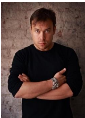
Fotografia 59. Igor Czapurin.