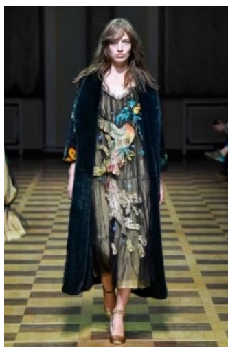
Fotografia 20. Kolekcja „Żar-ptak”

Kolekcja jesień-zima 2017-2018 była inspirowana rosyjskimi bajkami o żar-ptaku 7 i szarym wilku 8 .